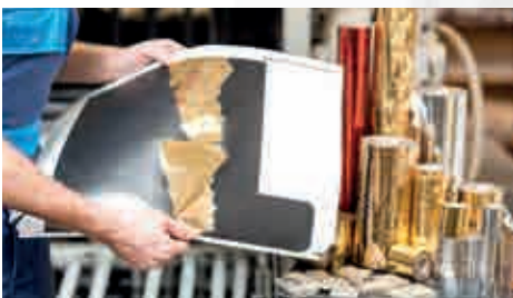
Procesamiento de plásticos y papel aluminio