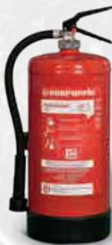
Extintor con presión incorporada WD 9 F-500