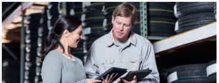
Fabricación, procesamiento y almacenamiento de caucho, incluidos neumáticos.