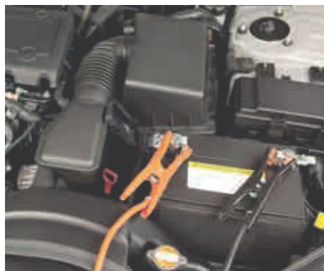
Baterías de coches eléctricos (magnitud superior a 15 kWh)