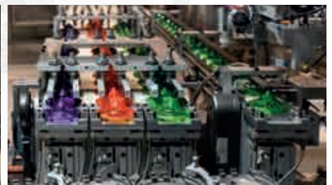
Fabricación, procesamiento y almacenamiento de plásticos. F-500 también protege a los portacargas.