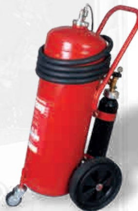
Extintor móvil con ruedas WA 50 F-500

Estos modelos ofrecen una excelente protección contra incendios para una variedad de aplicaciones de baterías de ion-litio, desde teléfonos móviles hasta scooters eléctricos. Además, disponemos de un extintor con contenido de 50 L para mayor seguridad del usuario (mayor cantidad de agente extintor, mayor tiempo de descarga).