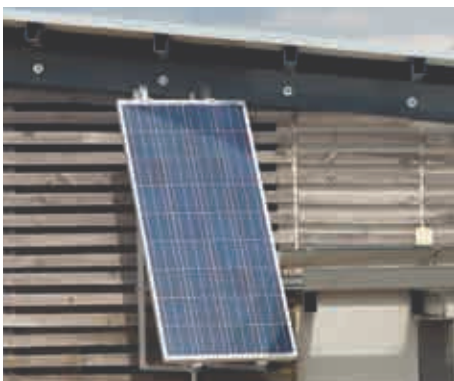
Almacenamiento de energía solar en hogares (magnitud 4-5 kWh)