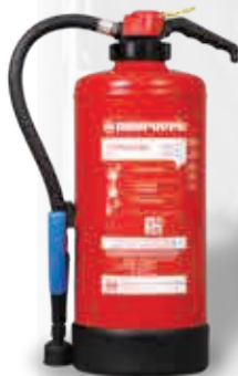
Extintor accionado por cartucho WA 9 F-500

Se realizaron pruebas exhaustivas en una batería de patinete eléctrico de 182 celdas (tipo 18650), un tamaño de batería más grande que las que se usan generalmente en dispositivos como teléfonos móviles, ordenadores portátiles, herramientas eléctricas, herramientas de jardinería, modelismo (por ejemplo, control remoto de automóviles, barcos, drones) y bicicletas eléctricas (que pueden usar baterías de 48 celdas). Neuruppin creó dos modelos diferentes de extintores portátiles de 9L con baterías de ion-litio hasta el tipo de batería probado con 1890 Wh (51,1 V / 37 Ah).