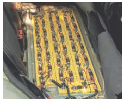
Áreas de almacenamiento de baterías grandes y/o desatendidas